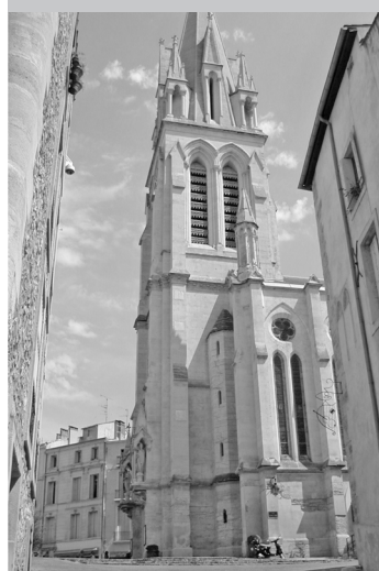
Parvis Eglise Sainte - Anne